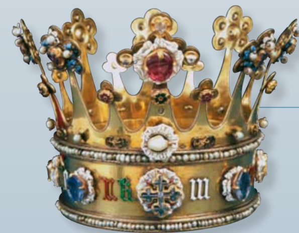
Das Monogramm von Margarete von York, Karls dritter Ehefrau, ziert die edelsteinbesetzte Krone. Aachen, Domschatzkammer

Die Ausstellung in Ruhe geniessen: Vergünstigter Eintritt mit Einlass Di bis Fr von 8.15 bis 9 Uhr. Dauer des Ausstellungsbesuchs unbeschränkt. Mit Bon für einen Gratis-Kaffee im Bistro Steinhalle ab 10 Uhr.