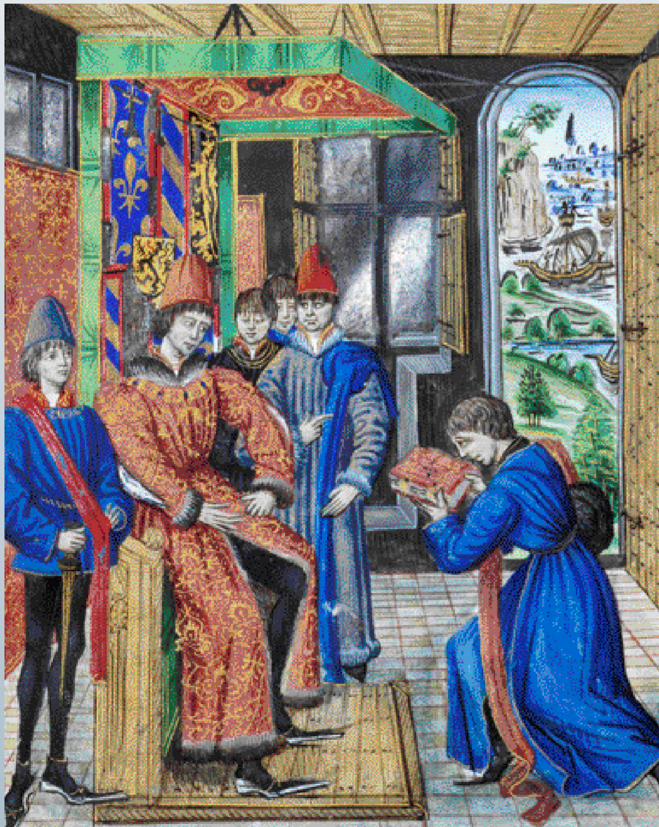
Wappenteppiche schmücken den Thronbaldachin Karls des Kühnen. Dedikationsbild aus einer illuminierten Handschrift. Brüssel, Bibliothèque royale de Belgique, ms. IV 1264

Der burgundische Hof im 15. Jahrhundert leistete sich bei Banketten die erstaunlichsten Zwischenspiele. Erstmals versucht die Ausstellung «Karl der Kühne», solche Festivitäten wieder zum Leben zu erwecken.